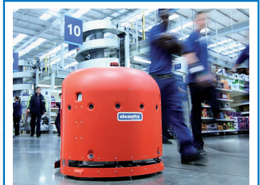
Centro comercial con obstáculos 60 min / 800 - 1000 m 2