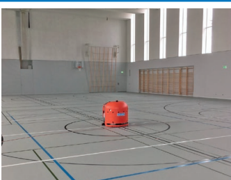
Pabellones deportivos sin obstáculos 60 min / 1400 m 2

RA660 Navi es adecuado para la limpieza completa y constante de supermercados, centros comerciales, oficinas de espacios abiertos, salas de exposición, grandes pasillos, edificios de fábrica, almacenes, pasillos y grandes espacios de aeropuertos.