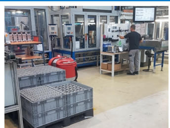
Ambientes con obstáculos 60 min / 700 - 800 m 2